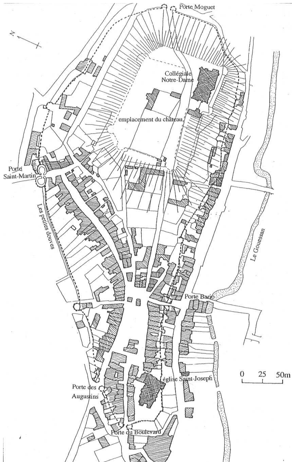
Annexe n° 2 : Lamballe. Restitution du site sur la base du cadastre de 1830 63 .