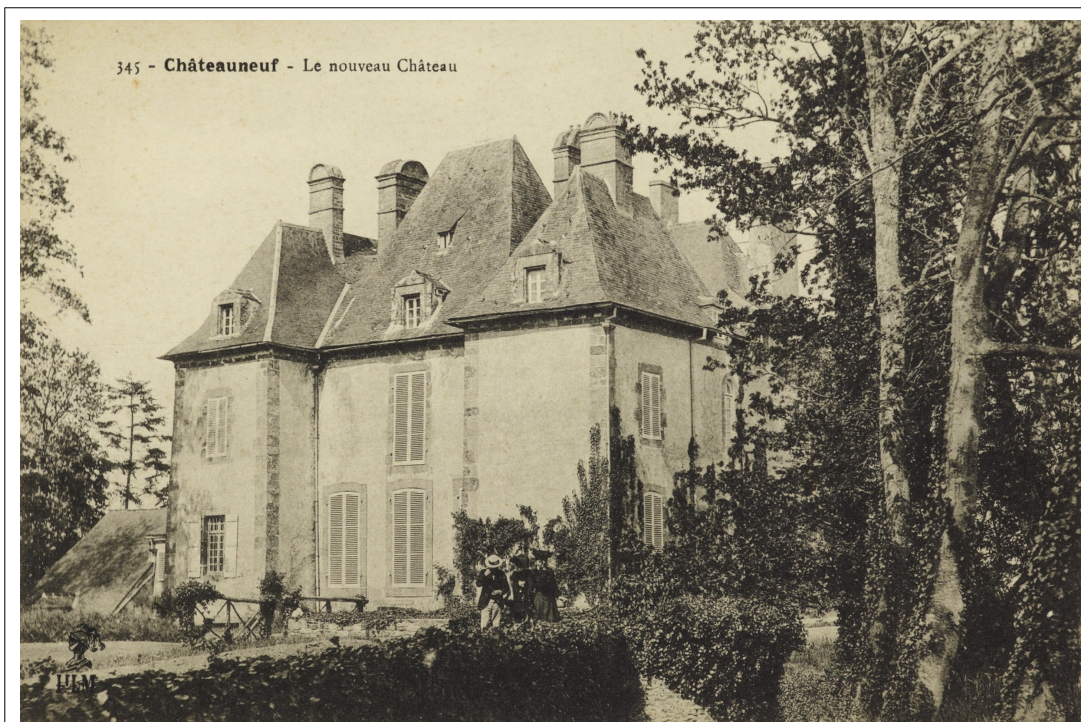
Nouveau Château ou Petit Château de Châteauneuf.