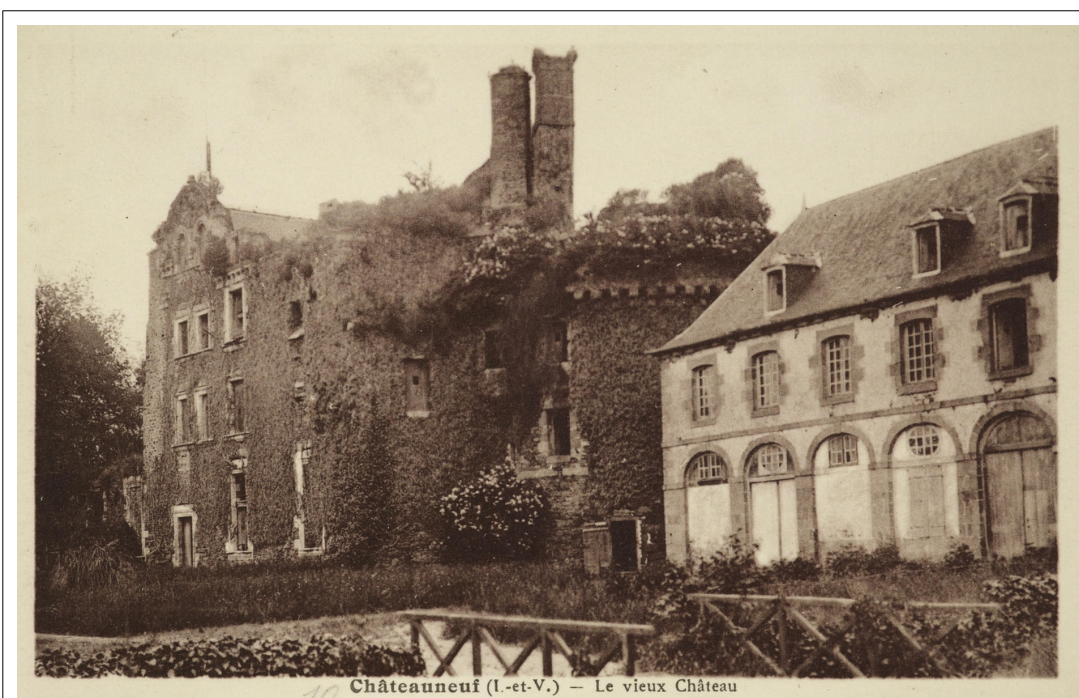
Le vieux château et le « corps de garde [...] avec grandes écuries ».

est situé et élevé, entouré d'autres grands fossés secs d'environ 50 pieds de largeur et de 40 de profondeur d'une figure quarrée isocelle, flanqué de plusieurs grosses tours, la plus part dans les angles d'iceluy, dans un costé duquel terrain et elevation, est un batiment où loge le senechal de la seigneurie de Chasteauneuf, avec sa famille, d'une jolie construction baty depuis 50 ans, ainsy qu'il nous a dit, par un seigneur de Rieux, et apellé le petit chasteau. Nous sommes ensuite entrés dans [folio 8] la premiere cour dudit chasteau, entourée de fossés, à costé gauche de la porte, de laquelle cour de figure triangulaire est une guerite en saillye et un petit corps de garde à droite avec plusieurs logements et grandes ecuries et remises pour carosses, qui l'environnent pour la plus grande partie. Après laquelle cour, avons passé par une