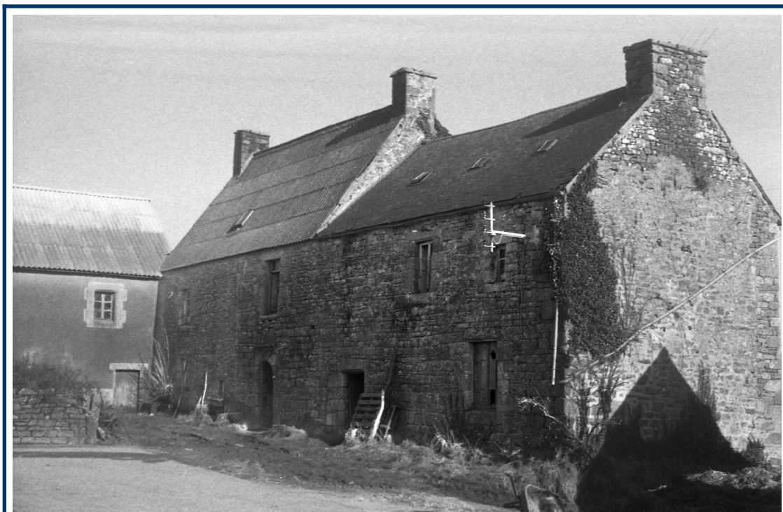
Manoir de Tréfalegan : élévation nord vue du nord-est (état en 1978).