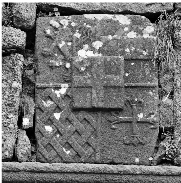
Tréfalegan, élévation nord : pierre armoriée au-dessus de la porte (état en 1986).