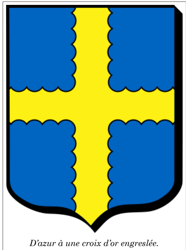
D'azur à une croix d'or engreslée.

Contract de mariage, de messire René de la Rivière, seigneur de Saint