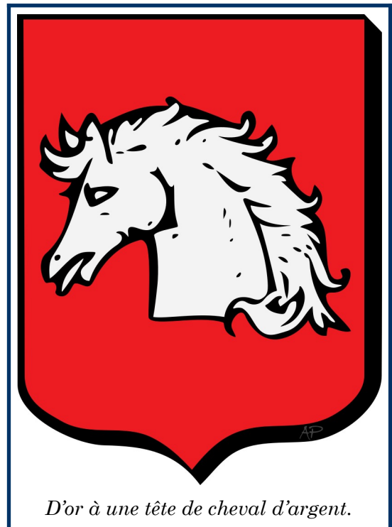
D'or à une tête de cheval d'argent.

La troisesme est un extraict tiré de la Chambre des Comtes de Bretagne, dans lequel est marqué au premier rang des nobles de l'evesché de Leon, lors de la refformation en faite, sous le raport de la parroisse de S t -Fregan, en l'an 1443, le sires de Penmarch.