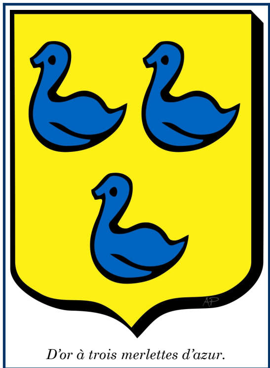
D'or à trois merlettes d'azur.