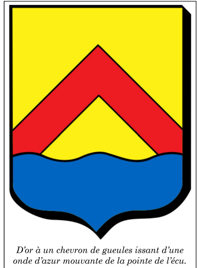
D'or à un chevron de gueules issant d'une onde d'azur mouvante de la pointe de l'écu.